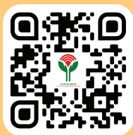
機構網頁 ( www.cdac.org.hk )

活動申請表可於 http://www.cdac.org.hk 下載， 請於填妥申請表後傳真回本會。 如有查詢，歡迎與本會聯絡。