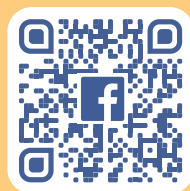
機構Facebook ( facebook.com/cdac1985 )

地址：香港皇后大道中99號中環中心地下7號單位 電話：2521 2880 傳真：2525 1317 電郵： enquiry@cdac.org.hk